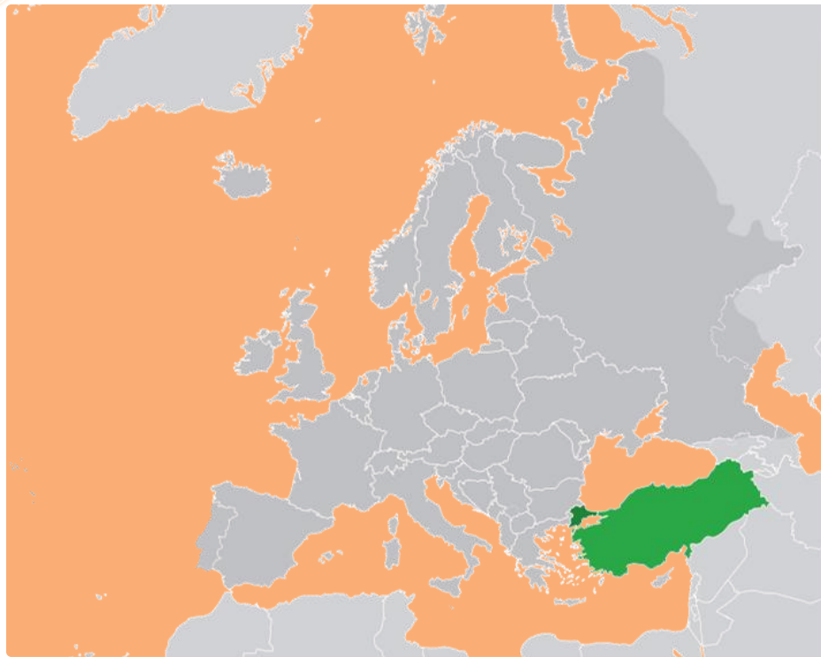
Η θέση της Τουρκίας στο χάρτη

Η Τουρκία βρίσκεται στη νοτιοδυτική Ασία, με ένα μικρό (3%) τμήμα της επικράτειάς της (Ανατολική Θράκη) στη νοτιοανατολική Ευρώπη. Συνορεύει δυτικά με την Ελλάδα, βορειοδυτικά με τη Βουλγαρία, ανατολικά με τη Γεωργία, την Αρμενία, το Ιράν και το Αζερμπαϊτζάν και νοτιοανατολικά με το Ιράκ και τη Συρία.